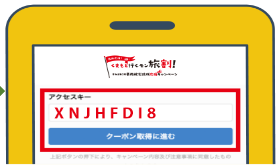
※画面はイメージです