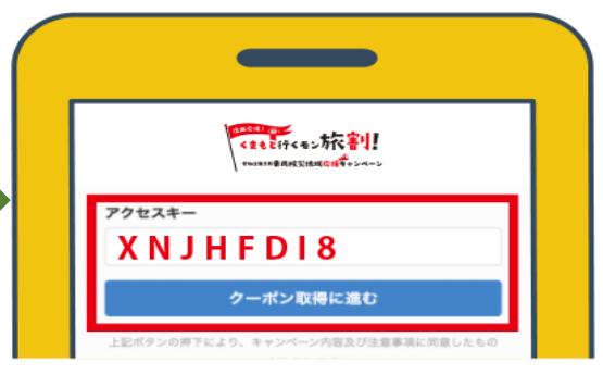
※画面はイメージです